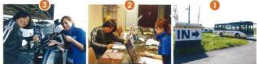
① 空港から無料送迎バスでオリックレンタカー新千歳空港店へ ② 受付カウンターで保険や返却方法などの説明を受け、料金を支払う ③ 外装にキズがないかどうかの車両点検やバイク機能の説明を受ける